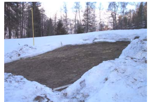
Visione invernale dell'area sperimentale 1