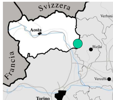
Localizzazione dell'area di studio

In ciascuna area sperimentale sono stati posizionati 2 data loggers (UTL1) per la misura della temperatura del suolo a 10 cm di profondità. Il suolo è stato completamente caratterizzato e classificato in accordo alla Soil Taxonomy come Typic Dystrochrept. Lo studio della dinamica degli elementi nutritivi è stata condotta mediante l'incubazione invernale di campioni di suolo all'interno di sacchetti in polietilene posizionati a 10 cm di profondità. Per quanto concerne la dinamica dell'azoto l'ammonificazione e la nitrificazione nette sono state calcolate come differenza fra la concentrazione iniziale e finale rispettivamente di azoto ammoniacale e azoto nitrico. E' stata inoltre calcolata la differenza di concentrazione dell'azoto organico disciolto ( \Delta DON) e dell'azoto microbico ( \Delta N micr ).