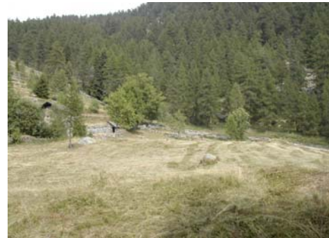
Visione estiva dell'area di studio